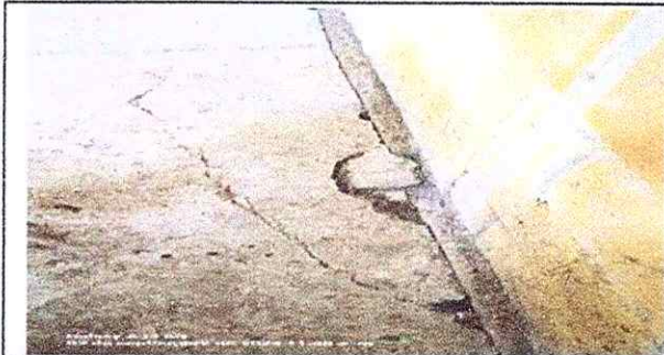
Foto 3: Se observa cambio de concreto torta, por piso de albero foresta