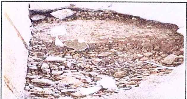
Foto 4: Se observa colocacion de entortado, y despues colocacion de piso de albero foresta en el aula.