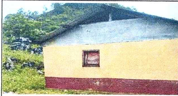
Foto1: Cambio de ventana de madera, por ventana de metal con vidrios