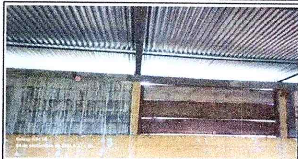
Foto 2: Sustitucion de tablas, por ventana de metal con vidrios. Ya cuenta con cinco hiladas de block.